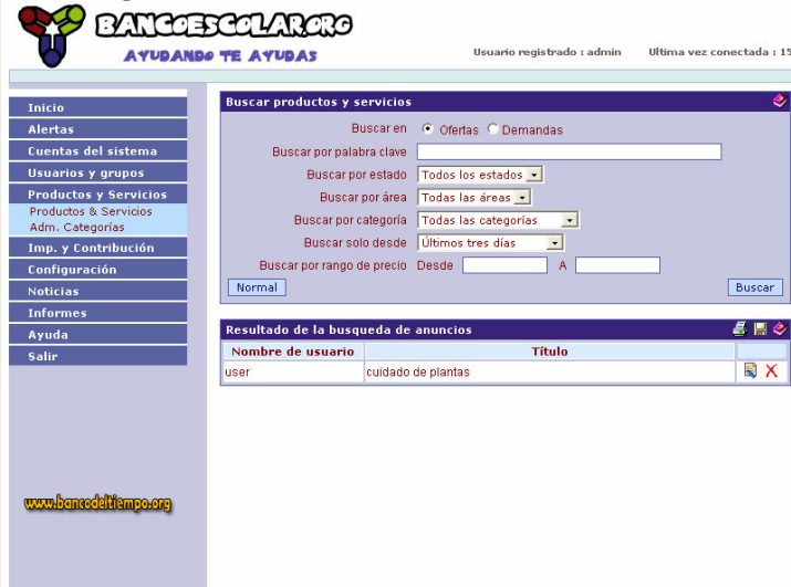
FIG11. Página de listado de anuncios.

En la página de listado de anuncios nótense los botones a la derecha de la caja de resultados, con ellos podemos imprimir, grabar, borrar y editar los anuncios. Referirse al manual de instrucciones del administrador para más información sobre como funciona cada uno. Pinchando sobre el nombre del anuncio podremos ver los detalles del mismo.